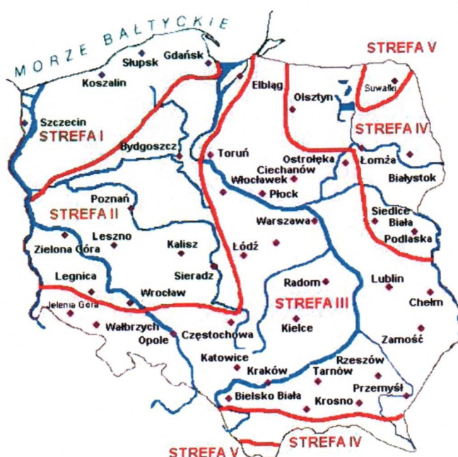
Rys. 1 Strefy klimatyczne Polski i temperatury obliczeniowe

Położenie obiektu, w którym planowany jest montaż, na mapie ma wpływ na pracę instalacji. W zależności od współrzędnych geograficznych rozbieżności w temperaturach projektowych mogą mieć znaczącą wartość. W skali kraju ilustruje to poniższa mapa (Rys.1).